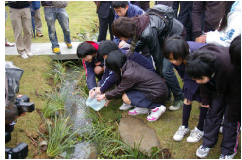
第6回WS めだか放流(メダカ育成交流)