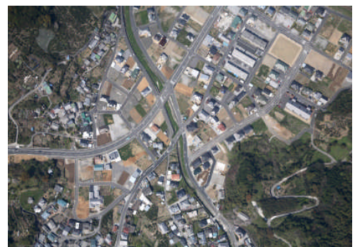
(整備後)平成 21 年 3 月 道路整備(基幹事業)・区画整理(提案)