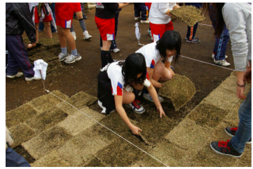
第5回 WS 公園づくり(メダカ育成交流)

本地区は、平成 8 年度より土地区画整理事業を実施しており、道路・公園の整備については協議を行ってきた。平成 18 年度より、まちづくり交付金事業を導入するにあたり、花いっぱい運動、メダカ育成交流、公民館建設などについて、地元との協議を行い、都市再生整備計画の策定に反映させた。