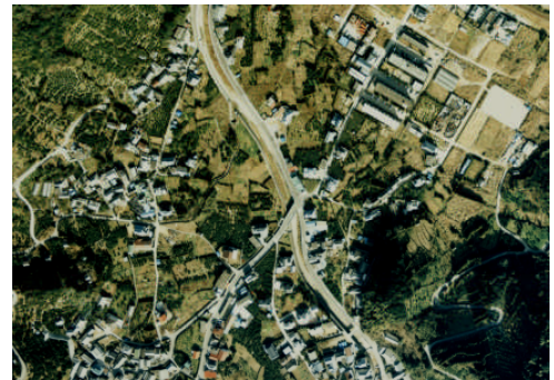
(区画整理施工前)平成 3 年