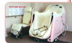
●車椅子対応のお風呂