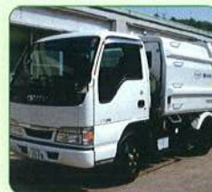
■ダンボール回収専用収集車