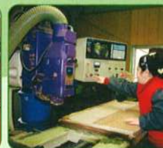
■コンピューター制御による木工品の製作