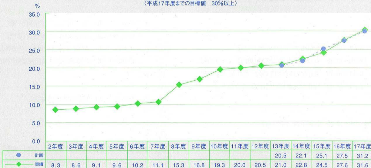
県の審議会等における女性委員の割合の推移 (平成17年度までの目標値 30%以上)

県民生活・男女共同参画課HP ( http://www.pref.oita.jp/13100/syakai/076/ )でもご覧いただけます。