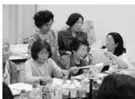
ひびき会のみなさん

消費者が主役となる社会の実現に向け、昨年9月に消費者庁が発足し、大分県でも消費者行政の充実・強化の取組がはじまりました。