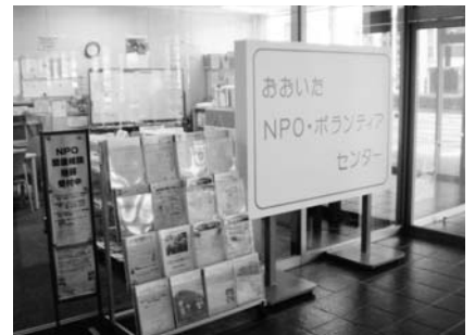
▲ここがセンターの入り口です!

県では県内のNPO・ボランティア活動の活性化と発展を図るために「おおいたNPO・ボランティアセンター」を運営しています。センターでは2名のコーディネーターによるNPOの設立、運営などについてのさまざまな支援業務や、各地のNPOへの専門的な知識を持つアドバイザー派遣業務、また「おおいたNPO情報バンク(おんぼ)」による各種の情報提供などの多角的な活動を行っています。