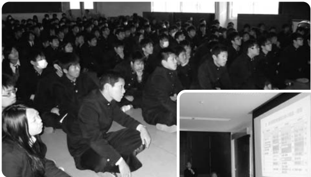
12月21日 大分県立中津工業高等学校