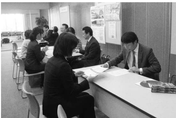
昨年度の説明会の様子