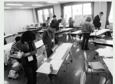
熱心に課題に取り組む受講生