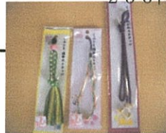
組みひも携帯ストラップ 組みひもメガネストラップ