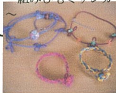
組みひもチョーカー 組みひもブレスレット