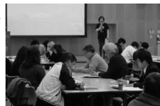
東日本大震災後3年間の取組報告

来年度もこのような意見交換会を実施し、減災をテーマとしたネットワークの必要性や重要性の理解を深めていく予定です。