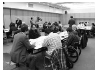
熱心にグループワークをおこなう参加者