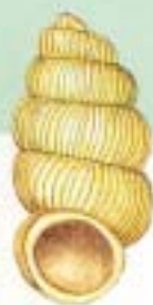
ヒダリマキゴマガイ