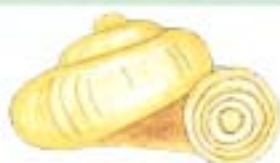
ミジンヤマタニシ