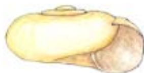
ミジンナタネガイ

オキギセルとシリオレギセルは比較的大きな貝で朽ち木などについています。その外の貝は殻の大きさが2mm前後の微小種で、落ち葉の下などにいます。小さいながらもデンデンムシと同様に2本の長い触角を伸ばして動きます。