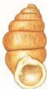
キュウシュウゴマガイ