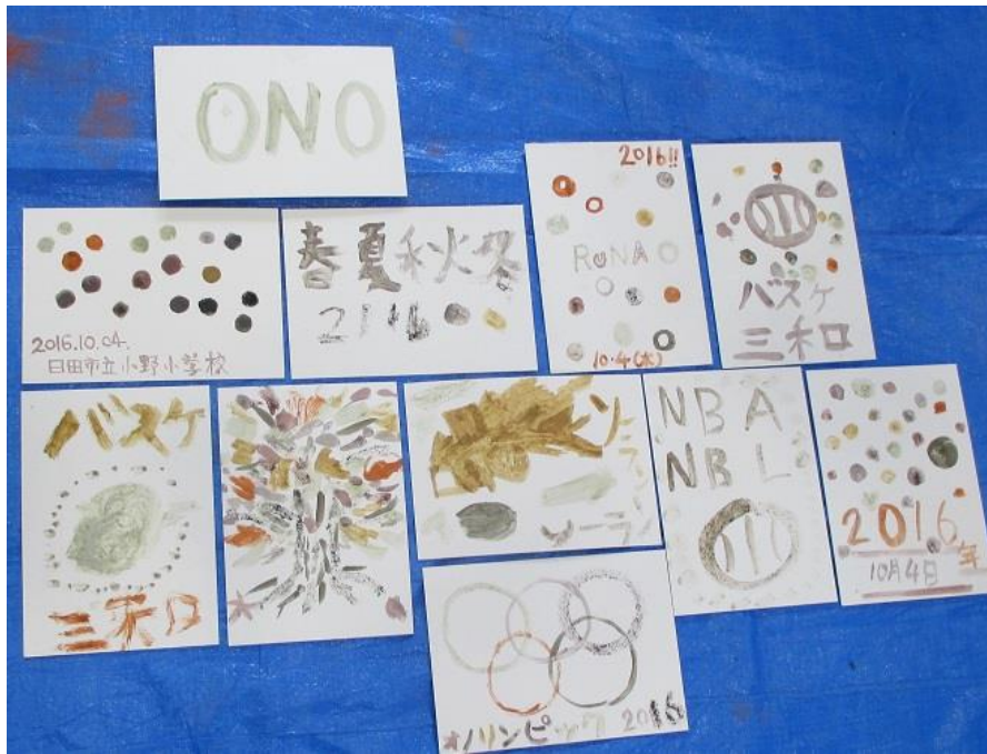
日田市立小野小学校の皆さんの、石を砕いて作った絵の具で描いた作品