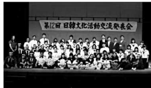
臼杵市民会館での記念写真