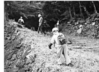
「つのむれ会」の草刈り