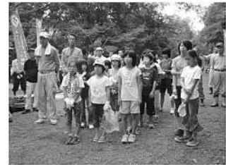
「宇佐文化財愛護少年団」の活動