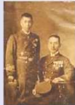
堀悌吉と山本五十六