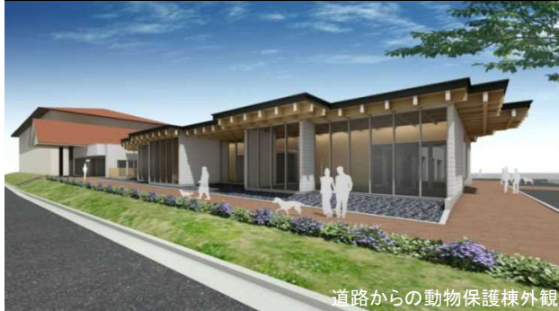
道路からの動物保護棟外観