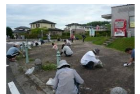
【サンバイザーの状況】

当隊では、自家用車に「防犯パトロール」と記載したサンバイザーを設置して、少しの外出でもパトロールができるようにしています。