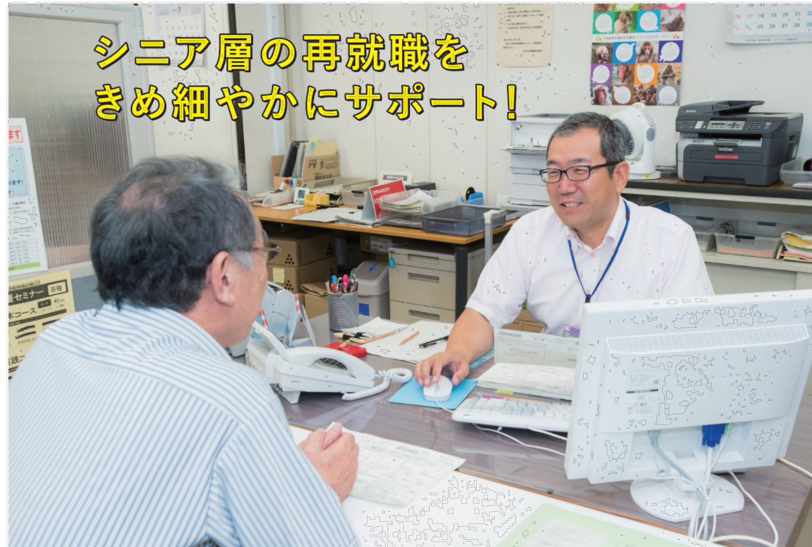
「大分県中高年齢者就業支援センター」では、4名の職業相談員と1名のキャリアコンサルタントが、就職活動をサポートしています。