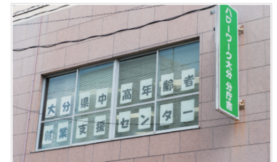
「大分県中高年齢者就業支援センター」は、「ハローワーク大分」北側のビル(ハローワーク大分 分庁舎内)の2階、階段をのぼって左手にあります。

が「大分県中高年齢者就業支援センター」です。同センターは、平成24年4月に大分県と国との連携機関として設立されました。保有する求人情報は「ハローワーク大分」と同じですが、主に再就職希望者の多い40歳以上の中高年齢者への就業支援に取り組んでいます。平成28年度の延べ利用者数は6072名、就職決定者数は717名でした。 同センターは相談員が求職者一人ひとりに向き合っており、これまで経験してきた仕事の内容や、今