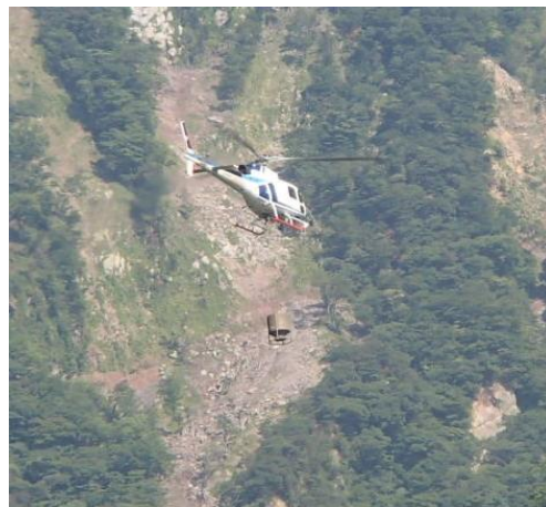
散布地に向かうヘリコプター