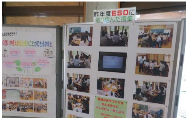
ESDカレンダーの修正