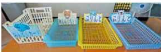
A 種類ごとにかごを用意することで、整理の仕方が分かりやすい。