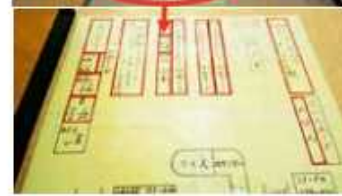
D 低学年生にも見やすいよう配慮された床表示