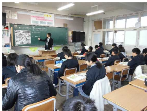
〈6年生 習熟度別指導〉