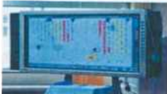
A 一時的又は拡大・強調して見せたい資料はICT機器を活用する。 ※必要ない時はOFF