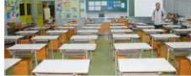
C 各自が集中できる環境スペース