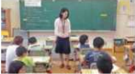
A 必要なときにすぐにサポートが受けられる工夫