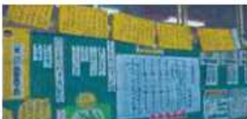
A ふりかえり等に使う資料は側面に掲示し、必要に応じて参照できるようにする。