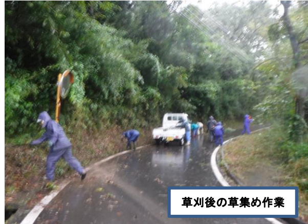
草刈後の草集め作業