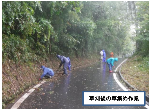
草刈後の草集め作業