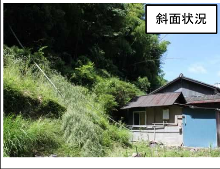
H30.7.6豪雨による崩壊状況