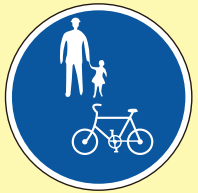
▲自転車及び歩行者専用