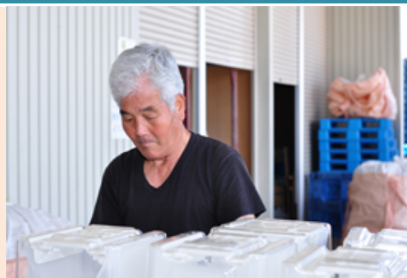
作業中の三重さん

新しい仕事に就くときは、これまでのこだわりを捨て、新入社員の気持ちを忘れないことがなにより大切だと思います。