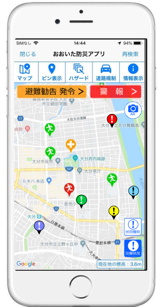
おおいた防災アプリ