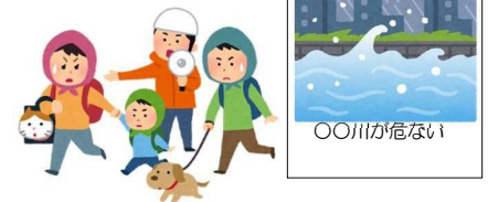
自助・共助のきっかけとなる、身近な地域・職場からの投稿を待っています。