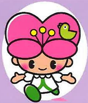
大分県人権啓発イメージキャラクター こころちゃん