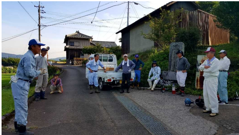
作業前のあいさつ