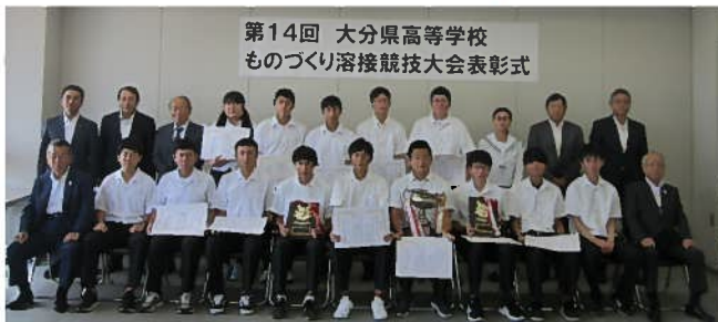
第14回 大分県高等学校 ものづくり溶接競技大会表彰式