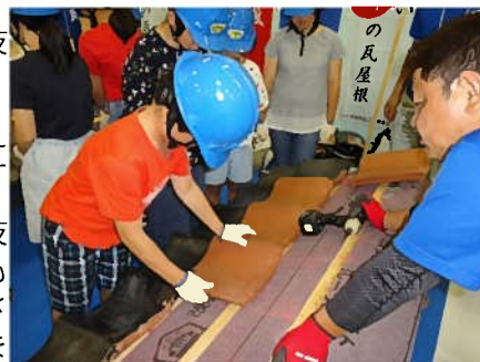
瓦葺きに挑戦するこどもたち

マイスターやI T マスター、熟練技能士による優しく丁寧な指導のもと、17種類の仕事に熱心に取り組み、技能士(プロ)の技の素晴らしさやものづくりの楽しさ等を実感していました。