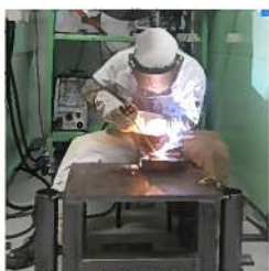
被覆アーク溶接を行う選手

本大会の成績上位者は11月に福岡県で開催される九州大会に大分県代表選手として出場します。