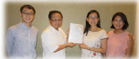
(写真) タイ、ベトナム、シンガポールで「任命式」に参加して下さった皆様