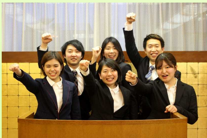
本年度派遣留学生

今年の学生の中には、春休みにさらに短期留学に行くなど、非常に意欲的な学生が多かったです。このような学生を支えていくため、皆様からの引き続きのご支援を頂ければ幸いです。