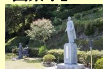
(国東市) ペトロ・カスイ岐部記念公園