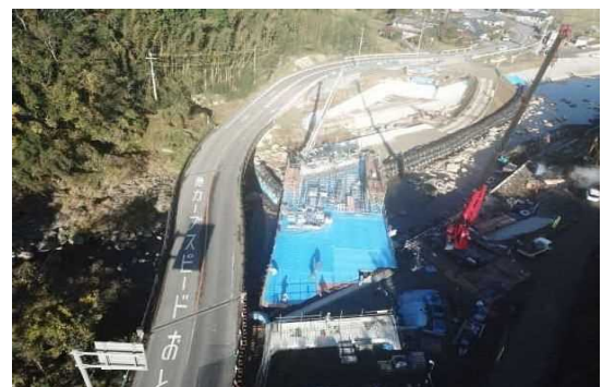
A2側より望む (架設支保工を組立っています)