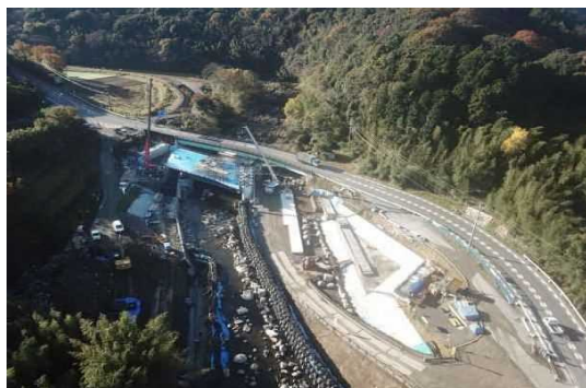
A1側より望む (支保工基礎を造っています)