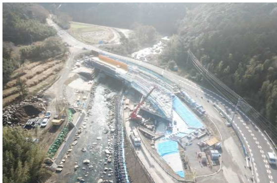
A1側より望む (架設支保工を組み立てています。)