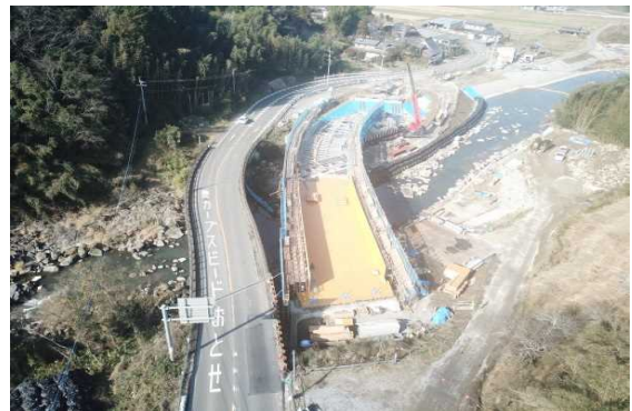
A2側より望む (型枠を組み立てています。)