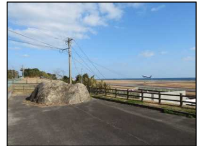
↑国東市 大分空港展望公園