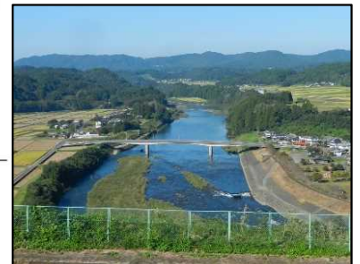
↑豊後大野市 江内戸の景