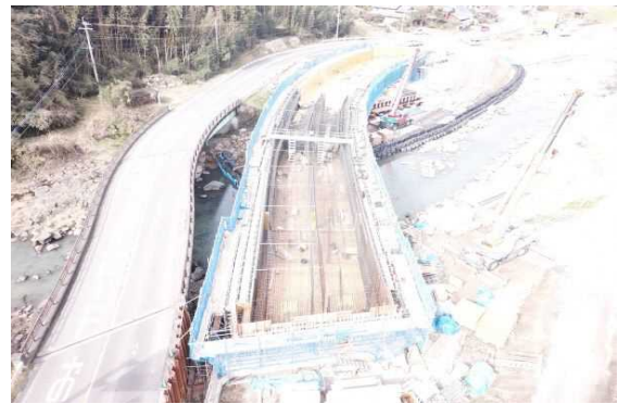
A2側より望む (鉄筋を組み立てています。)