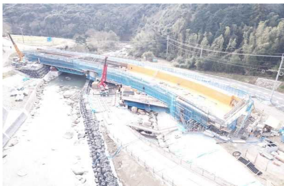
A1側より望む (型枠を組み立てています。)