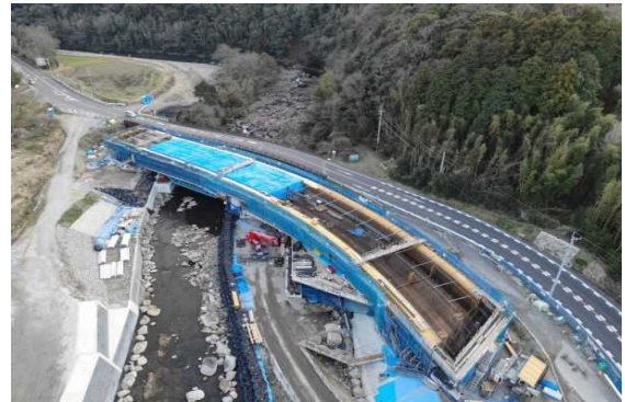
A1側より望む (コンクリート打設後のシート養生状況)