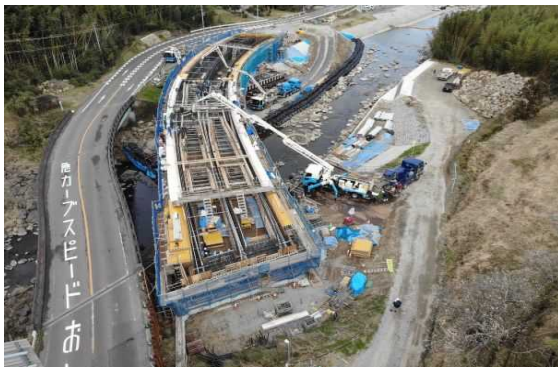
A2側より望む (コンクリート打設状況)