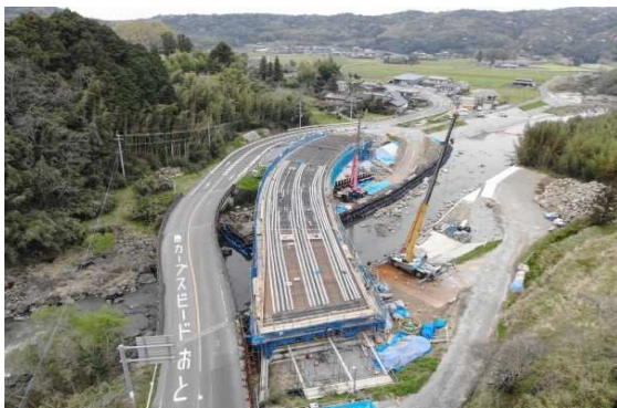
A2側より望む (2リフト目鉄筋組立状況)