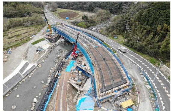
A1側より望む (2リフト目鉄筋組立状況)