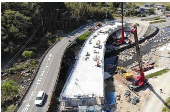
A2側より望む (橋体コンクリートの打設終了しました)