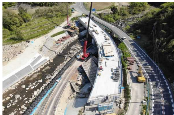
A1側より望む (支保工解体状況)