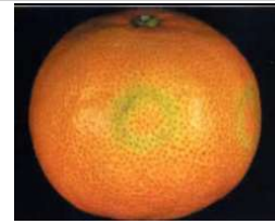
アザミウマの被害

アザミウマ類は青や黄色を認識し誘引されますが、赤色は認識できません。そのため、侵入経路とされるハウス側面開口部に赤色ネットを張るとハウス内が真っ黒に見えるため侵入を軽減できると考えられています。県内では、イチゴ施設で導入実績があることから、施設カンキツでも外部からの侵入軽減に有効ではないかと考え、試験を実施しました。