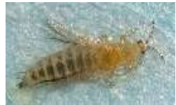
ミカンキイロアザミウマ