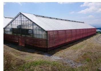
現地試験圃場(赤色ネット区)

グループ内試験の結果を基に、杵築市の「天草」生産者3戸(各10a)において、赤色ネット区(0.8mm目)、白色ネット区(0.8mm目)、慣行ネット区(4mm目)の3区を設置しました。サイドビニール開放後からハウス内・外に設置した粘着トラップで、アザミウマ類の誘殺状況を定期的に調査し、現地圃場における赤色ネットの侵入軽減効果を調査中です。また、各ハウス内外に温度計を設置し、気温を計測することで、慣行よりも細かい目合いのネットが、通気性などハウス内環境に影響していないかについても調査します。