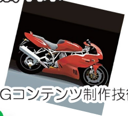
CGコンテンツ制作技術