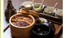
(日田市) 日田うなぎ