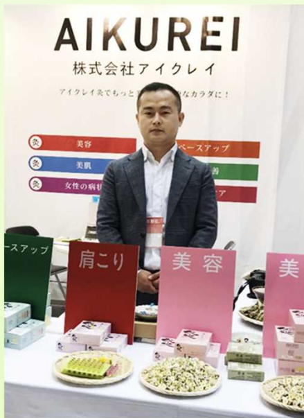
いろいろな製品を開発しています

大分県では平成28年度から「おおいた留学生ビジネスセンター」を設置し、留学生の県内起業及び県内就職の促進を図っています。現在、同センターには、元留学生が起業した会社等9社が入居しており、今回は、お灸の製造・販売を行っている(株)アイクレイさんを紹介いたします。