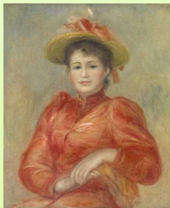
ピエール=オーギュスト・ルノワール 《赤い服の女》1892年頃

大分県立美術館開館以来初となる、本格的な西洋絵画の世界を堪能できる展覧会となっています。