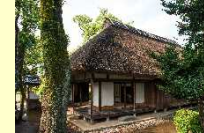
(日田市) 咸宜園(かんぎえん)