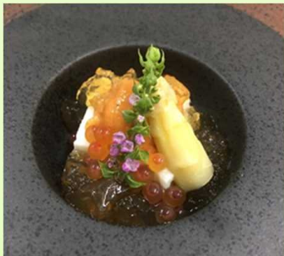
こんな料理を作っています