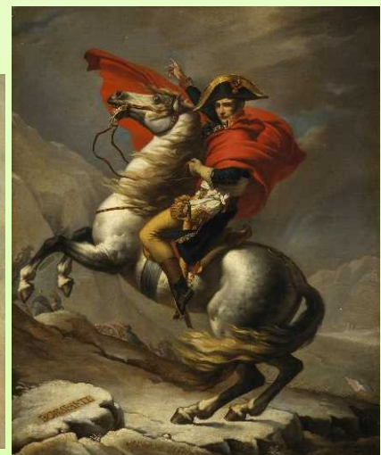
ジャック=ルイ・ダヴィッドの工房 《サン=ベルナール峠を越えるポナパルト》1805年