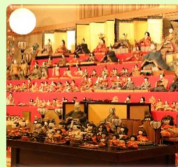
天領日田おひなまつり

江戸時代には幕府の直轄地「天領」として、九州の政治経済の中心的役割を果たし、独自の町人文化が栄え、古い街並みが残る豆田町では、今でもその栄華を感じる事が出来ます。また、日田市では5月には初夏の訪れを告げる「日田川開き観光祭」、7月には約300年の歴史を持つ「日田祇園祭」、11月には江戸時代の栄華を再現する「日田天領まつり」、そして2月からは春の訪れを告げる「天領日田おひなまつり」などの四大祭りを含め、年間を通して数多くのお祭りが開催されます。