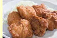
(中津市) 中津からあげ