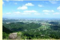
(中津市) 八面山(はちめんさん)