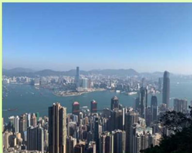
香港の高層ビル街

香港に来て驚いたのは、香港の方々のパワーです。最近でこそコロナなどの影響で外出する人が減っていますが、普段は人口密度が高く、人々が忙しく動いており、茶餐廳(チャーチャンテーン:香港式カフェレストランのこと)はいつも人がいっぱいですし、至る所にある街市(ガイシ:地元の市場)もいつも賑わっています。