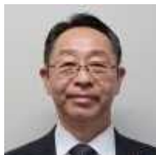
福岡 弘毅 大分県 生活環境部防災局 防災危機管理監