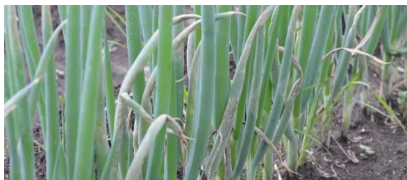
べと病を発病したネギ

ネギベと病は白ネギ栽培において重要な病害です。特に春の安定生産に大きく関わるため、病害虫対策チームでは平成30年から対策試験を実施し、ネギベと病に有効な薬剤の探索及び効果的な散布時期の検討を行いました。その結果、保護殺菌剤マンゼブを含む農薬の予防効果が高いことがわかりました。また、マンゼブを含む農薬を用いた防除体系を豊後高田市で令和元年12月から2年6月に実証した結果、十分な防除効果を確認しました。