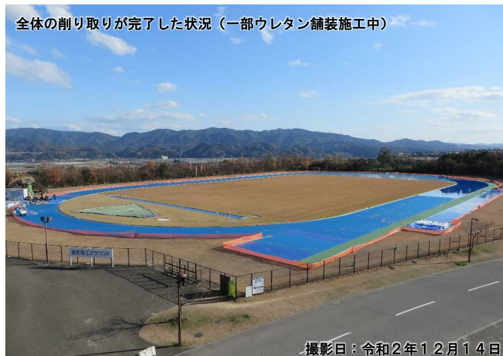
全体の削り取りが完了した状況（一部ウレタン舗装施工中）