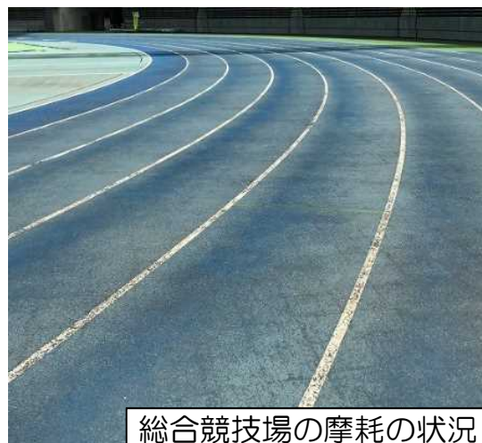
総合競技場の摩耗の状況

大分スポーツ公園の陸上競技用トラックは、舗装施工後、総合競技場は約17年、サブ競技場は約15年が経過し、摩耗や損傷、弾力性低下等の劣化が進行しているため、劣化した表面を削り取った後、ウレタン舗装を施工する方法により、舗装を新しくしています。