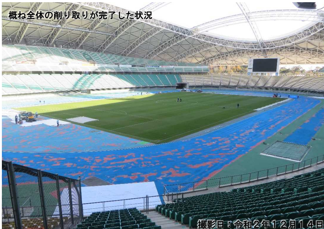
概ね全体の削り取りが完了した状況