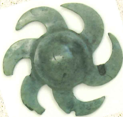
◀雄城台遺跡 巴形銅器 県立大分雄城台高校（大分市） 弥生時代 ※大分県指定有形文化財