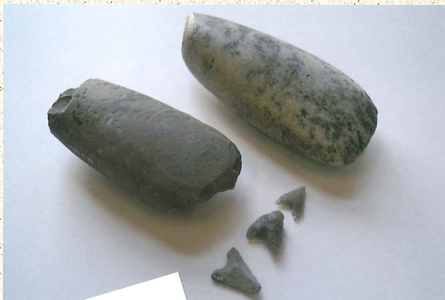
▲羽室遺跡 石斧・石鏃 旧県立別府羽室台高校（別府市） 縄文時代