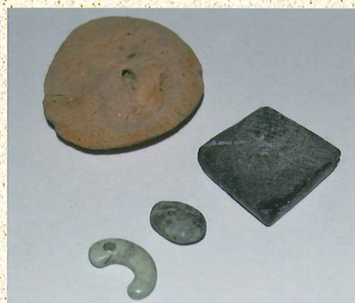
▲高畑遺跡 土製模造鏡・石製装身具 県立中津南高校（中津市）古墳時代