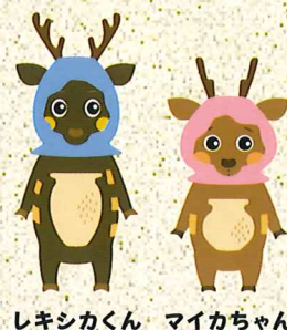
レキシカくん マイカちゃん

春は卒業式や入学式といった、学校では大きな行事が行われる季節です。学校の多くは地域の中心的位置にあるため、遺跡の上に建つ学校も少なくありません。本企画展では、そうした学校の足下に眠っていた遺跡から発掘された資料を中心に紹介します。“学校の遺跡”を通して、遺跡が身近にあることを感じ、地域の歴史や文化に思いを馳せてみませんか！