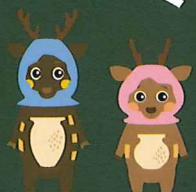
レキシカくん マイカちゃん