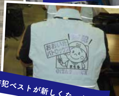
防犯ベストが新しくなったよ！