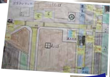
防犯マップ作成の授業も！