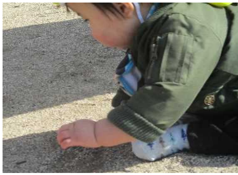
影に不思議がるB児:「??? う〜ん?」