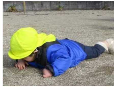
A児の気持ち:「これ、なにかなあー?」