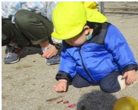
「いろんなはっぱあるね!」