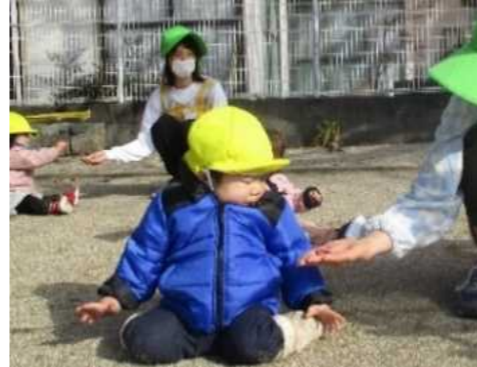
「せんせいもみつけたよ!」