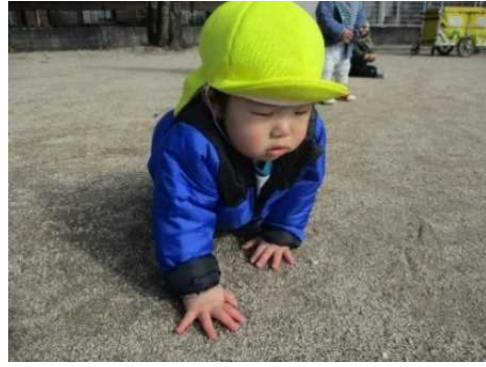
A児の気持ち:「あっちにもいってみよう!」