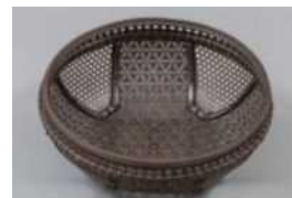
生野祥雲齋《重陽華盛筥》1953年