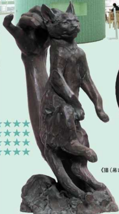
朝倉文夫 《猫(吊された猫)》 1909年