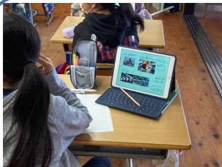
5年 社会科⇒1人1台端末の活用