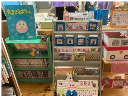
図書館環境の整備