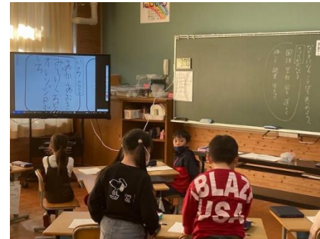
2年 国語科 ⇒ワークシートの写真