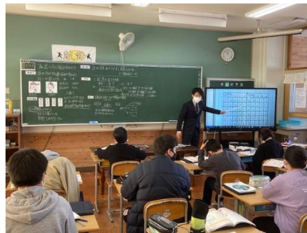
6年 算数科 ⇒ICT機器の活用