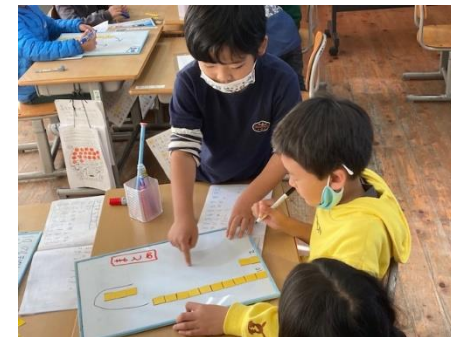
1年 算数科 ⇒タイル、ホワイトボード