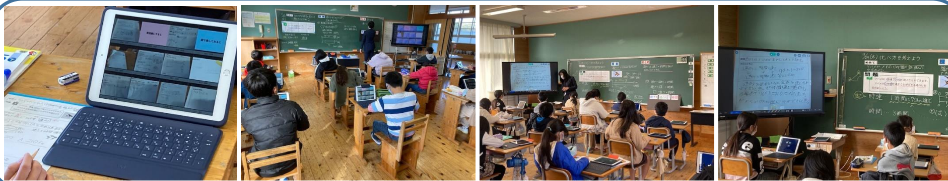
5年 算数科 ⇒ 1人1台端末の活用