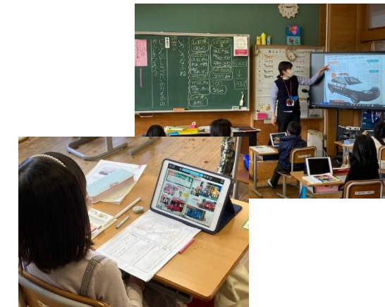
1年 国語科 ⇒ 1人1台端末の活用