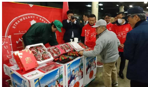
市場関係者、仲卸への試食宣伝イメージ