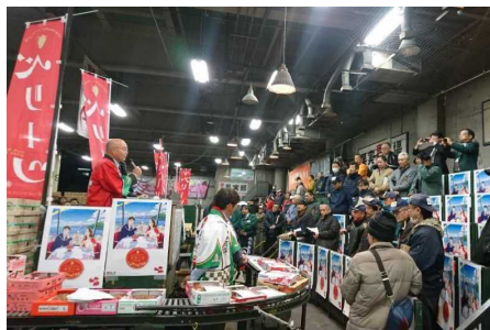
セリ前産地PRイメージ