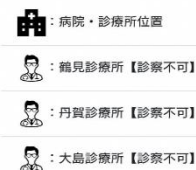
遠隔診療システム イメージ