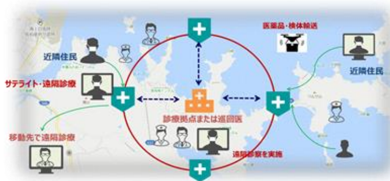
オンライン診療・服薬指導、ドローン配送 実証実験イメージ図