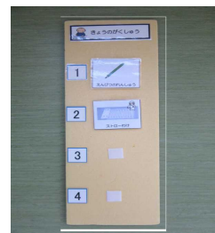
【スケジュールボード】