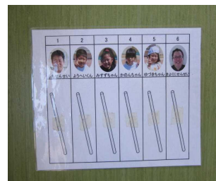
【配る人の写真を貼ったシート】