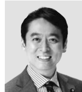
平木 だいさく 現 役職:元経済産業大臣政務官、参院議員1期。 経歴:東京大学法学部卒。 年齢:44歳 未来をひらく 確かな実力!