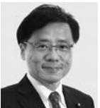
党参院幹事長・国対委員長 井上 さとし 現 61歳。参院議員3期。 活動地域 東海、北陸信越、京都