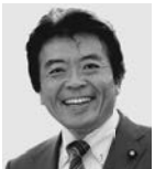
弁士 仁比 そうへい 現 55歳。参院議員2期。党参院国対副委員長。 活動地域 中国、四国、九州・沖縄