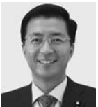
党副委員長 山下 よしき 現 59歳。参院議員3期。 活動地域 大阪、兵庫、滋賀、奈良、和歌山