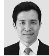
新妻 ひでき 現 役職:元文部科学大臣政務官、参院議員1期。 経歴:東京大学大学院修士課程修了。 年齢:48歳 「ものづくり」でこの国を元気に!