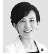
山本 かなえ 現 役職:元厚生労働副大臣、参院議員3期。 経歴:京都大学文学部卒。 年齢:48歳 「あなたの声を、かなえるチカラ。」