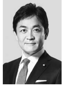
国民民主党 代表 山本太郎