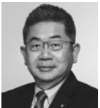
党書記局長 小池 晃 現 59歳。参院議員3期。全国革新懇代表世話人、医師。 活動地域 東京