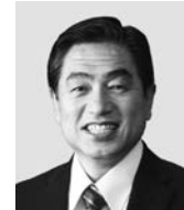
若松 かねしげ 現 役職:元復興副大臣、参院議員1期。 経歴:中央大学二部卒、公認会計士。 税理士、行政書士。 年齢:53歳 「現場第一」で復興・防災に全力